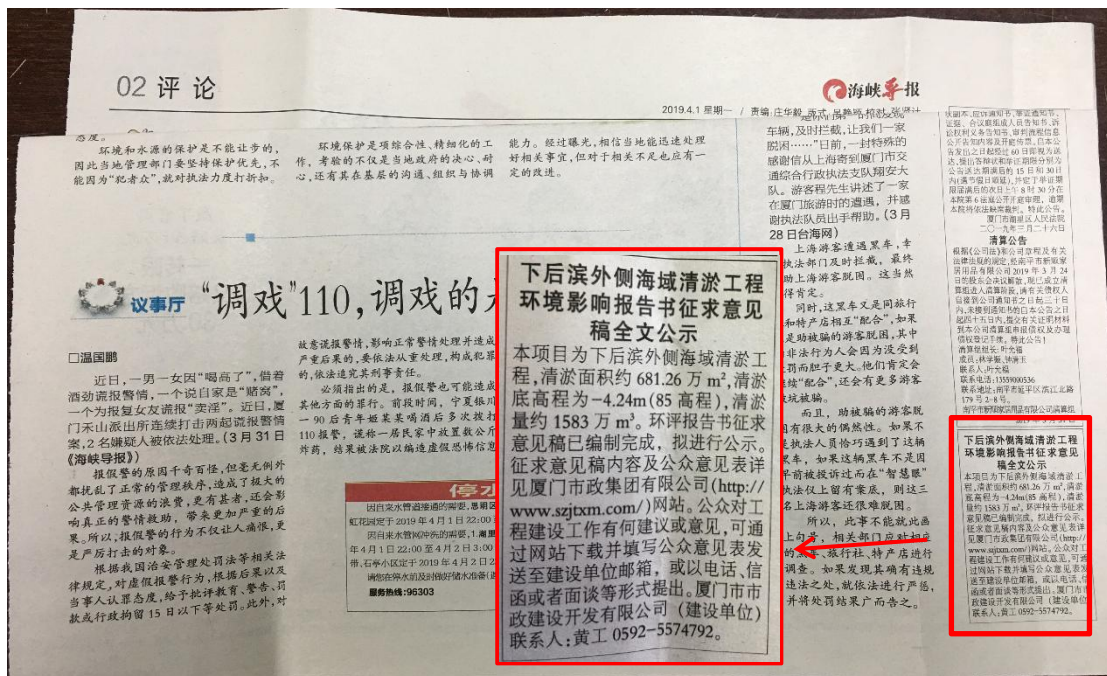
图 3.3 2019 年 4 月 1 日征求意见稿全文的报纸《海峡导报》公示