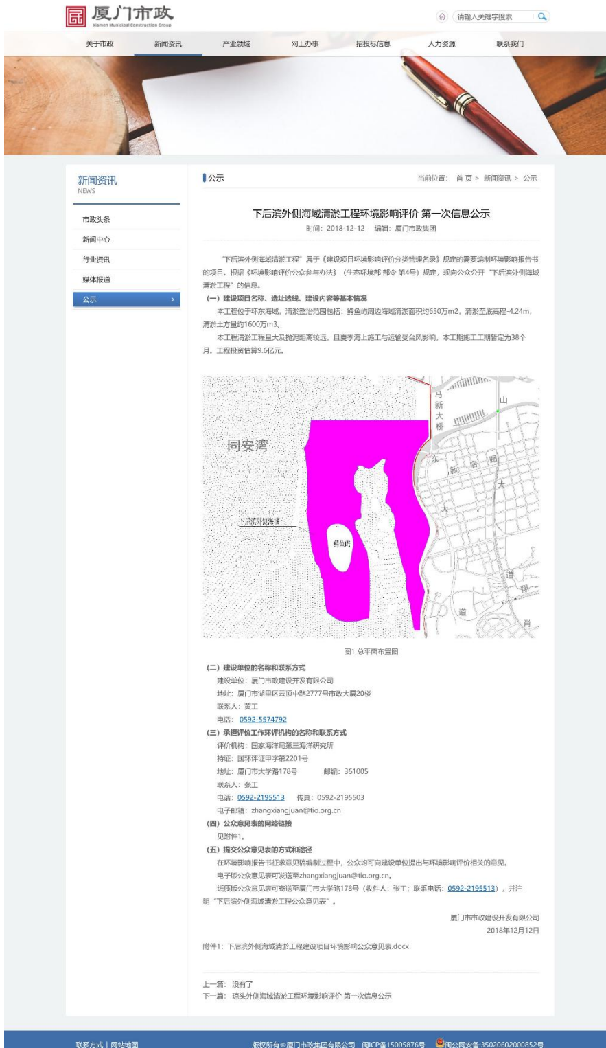
图 2.1 2018 年 12 月 12 日网络第一次公示