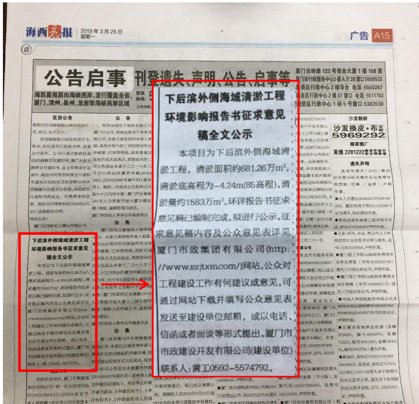
图 3.2 2019 年 3 月 25 日征求意见稿全文的报纸《海西晨报》公示