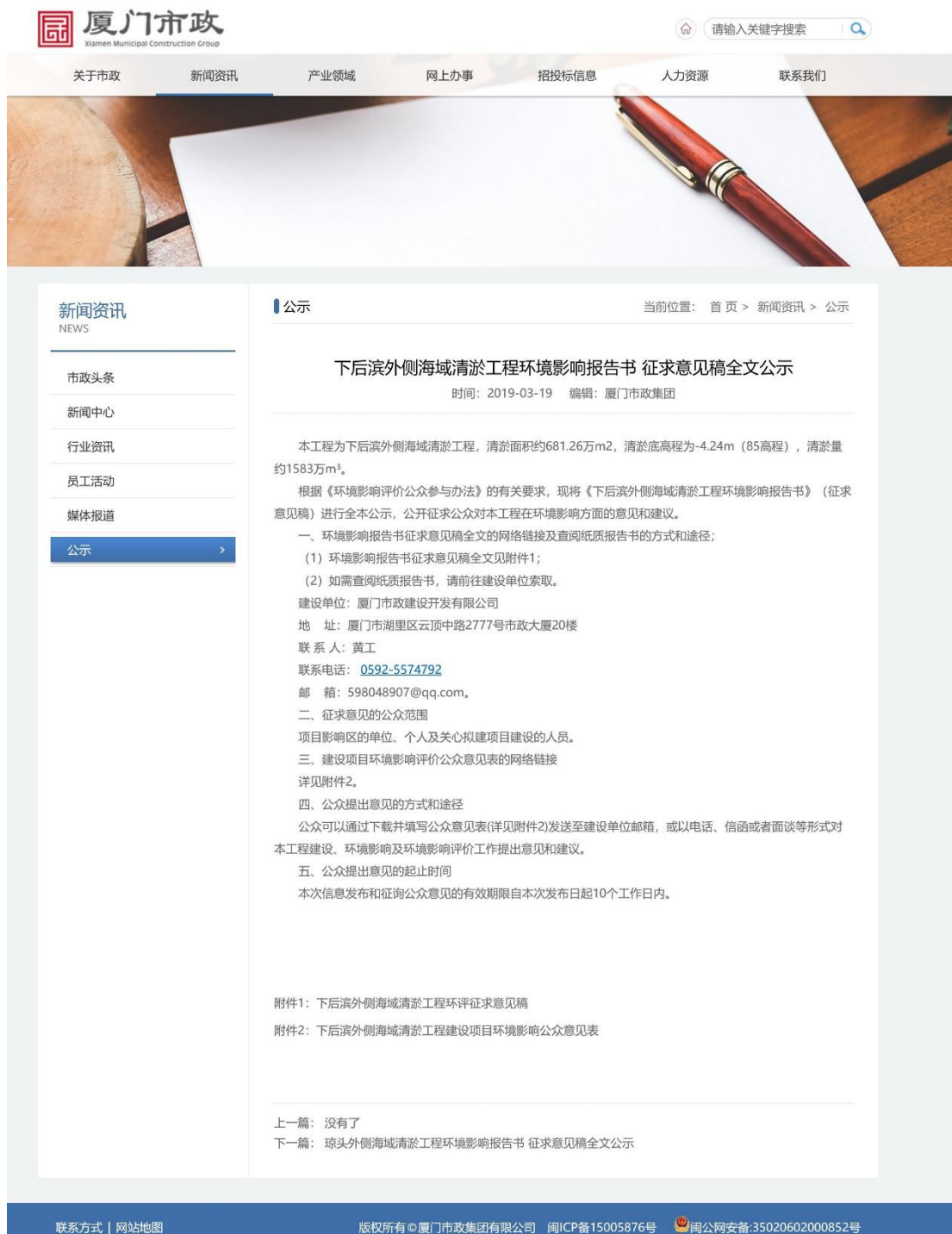
图 3.1 2019 年 3 月 19 日征求意见稿全文的网络公示